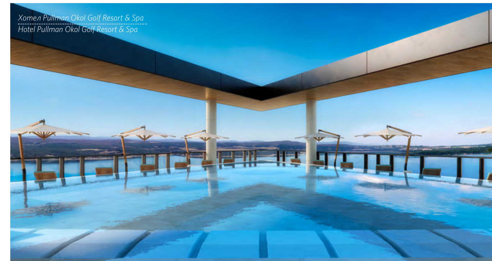
Хотел Pullman Okol Golf Resort & Spa Hotel Pullman Okol Golf Resort & Spa

houses, studios and lofts will be put into operation in 2022. The total value of the investment is BGN 300 million and the project is owned by Markan Holding AD – a Bulgarian company which manages an investment portfolio of companies in various sectors of the economy. The consolidated assets of the company stand at approximately BGN 120 million, with its key investments mainly in the hospitality industry, real estate, construction.