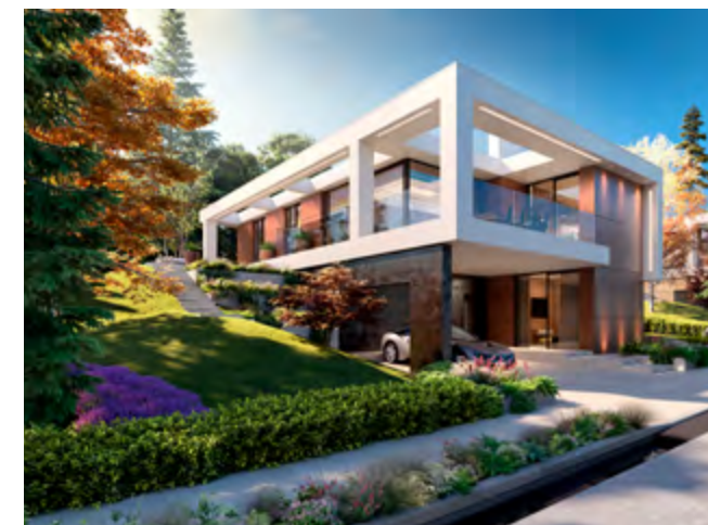
Концептуална разработка на къща в зона Изток Concept house in the Residential Group East

О KOL Lake Park – the newest golf resort in Bulgaria, will be situated in the Iskar reservoir area, some 35 km from the capital. The project, to be developed on an area of 740 acres, will be a large-scale complex of the 'Golf & Residential Community' type and will include a golf course, a five-star hotel, an office area, parks and residential quarters. It will be surrounded by untouched nature, looking out over an incredible expanse and spectacular panoramic views in all directions – over the reservoir and the Rila, Vitosha and Balkan mountains. The project will be implemented together with several international partner organisations. The hotel complex will be managed by the French operator AccorHotels and will function under the luxury Pullman brand in the 5-star category. Also a key partner in the project development is International Management Group (IMG) – a world leader in sport management and the operator of the golf course, the clubhouse and the golf academy at OKOL Lake Park. IMG Prestige is a global network of about 200 elite courses in 34 countries. The golf course is designed by European Golf Design (EGD), with leading architect Robin Heisman, and the master plan of