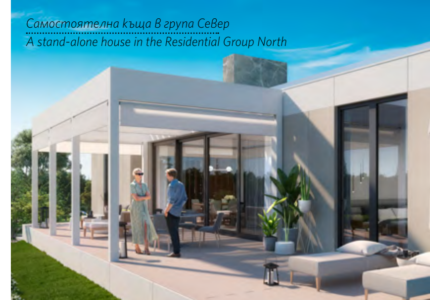
Самостоятелна къща в група Север A stand-alone house in the Residential Group North

Общата стойност на инвестицията е в размер на 300 млн. лева, а проектът е собственост на „Маркан Холдинг“ АД – българска компания, която управлява инвестиционен портфейл от дружества в различни сектори на икономиката. Активите на компанията на консолидирана база са на стойност около 120 млн. лева, като ключовите ѝ инвестиции са в областта на хотелиерството, недвижимите имоти, строителството.