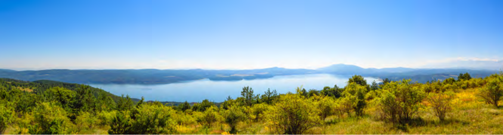
Невероятните панорами към яз. Искър са отличителната черта на OKOL Lake Park The astounding panoramas over Iskar reservoir are a distinctive feature of OKOL Lake Park

къщи, самостоятелни къщи и парцели с гледка към язовира.