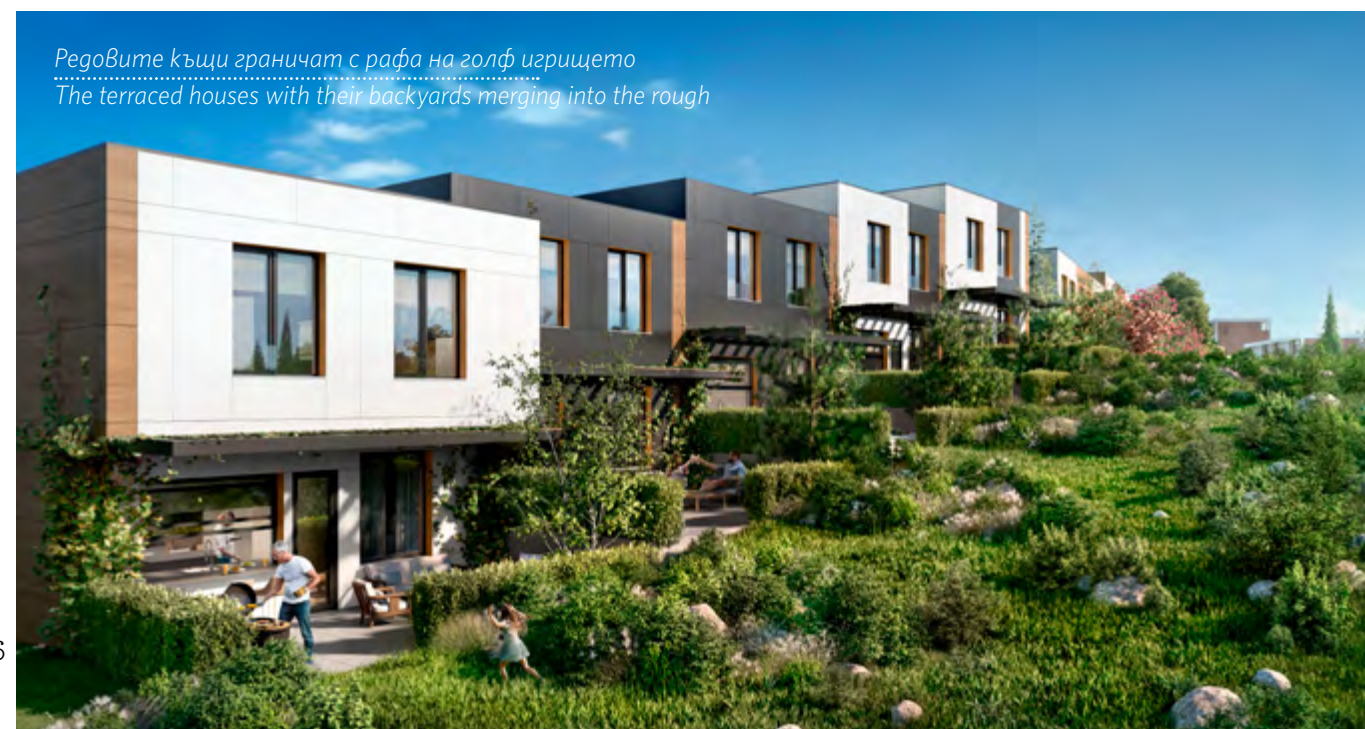
Редовите къщи граничат с рафа на голф игрището The terraced houses with their backyards merging into the rough